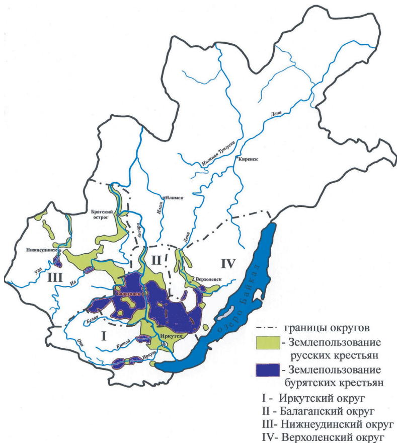
Землепользование русских и бурятских крестьян Иркутской губернии в конце XIX в.

(Иркутский, Балаганский, Нижнеудинский, Верхленский округа) 183